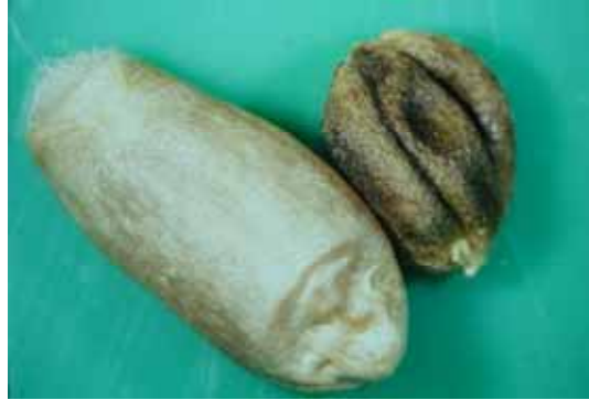
17. 罹小麥腫癭線蟲之麥粒(右)，(左)健康麥粒