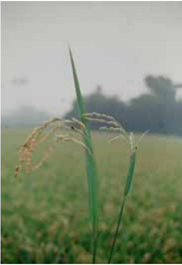
1. 水稻白尖病 左：健穗 右：病穗