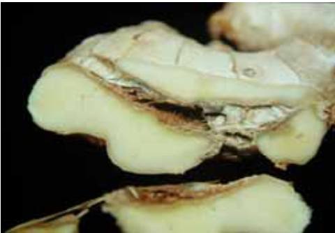
9. 罹穿孔線蟲薑塊內部有隧道型病徵