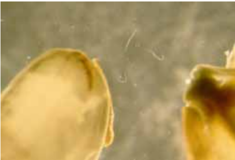
2. 線蟲自白尖病穀粒中游出