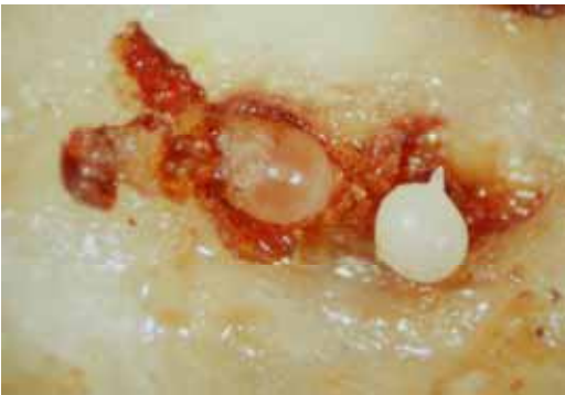
16. 罹根腐線蟲山藥薯塊表層組織中之根腐線蟲