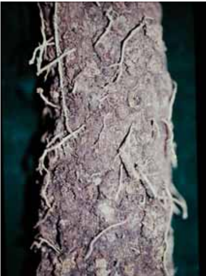
15. 罹根腐線蟲山藥薯塊表面有疣狀突起