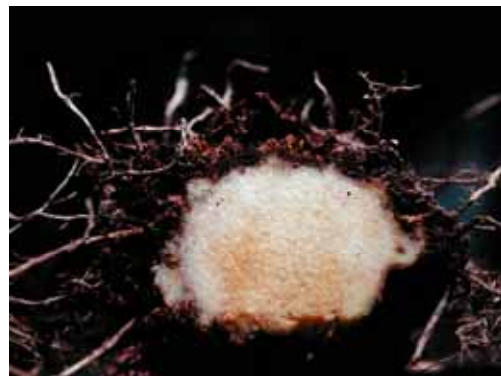
13. 罹根腐線蟲山藥薯塊表層組織成黑腐狀