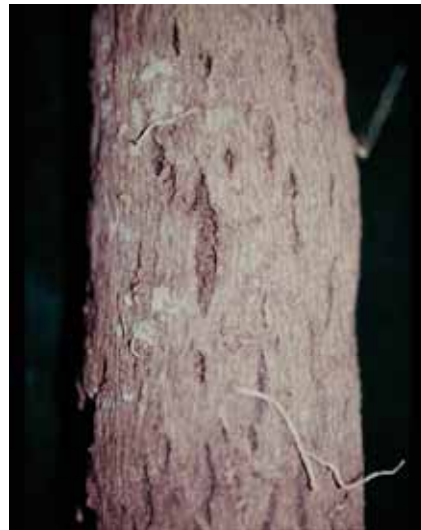
12. 罹根腐線蟲山藥薯塊表面有裂紋