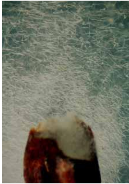
18. 切開腫癭麥粒，其中之線蟲一湧而出