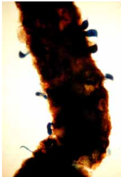
19. 半內寄生性之柑桔線蟲