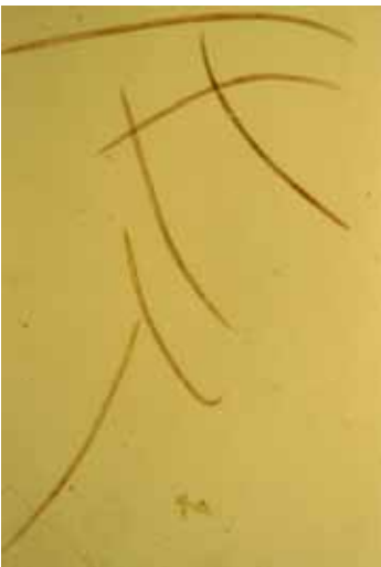
3. 水稻白尖病葉芽線蟲